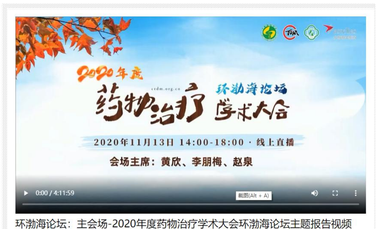
环渤海论坛：主会场-2020年度药物治疗学术大会环渤海论坛主题报告视频

首页 > 资源共享 > 环渤海论坛：主会场-2020年度药物治疗学术大会环渤海论坛主题报告视频